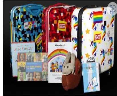
LSBTI*-Medienkoffer | Stadt Braunschweig → Bücher, Spiele und Methoden rund um das Thema sexuelle und geschlechtliche Vielfalt.