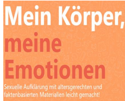
Das bin ich! - sexedu.eduskills.plus (Online/App)